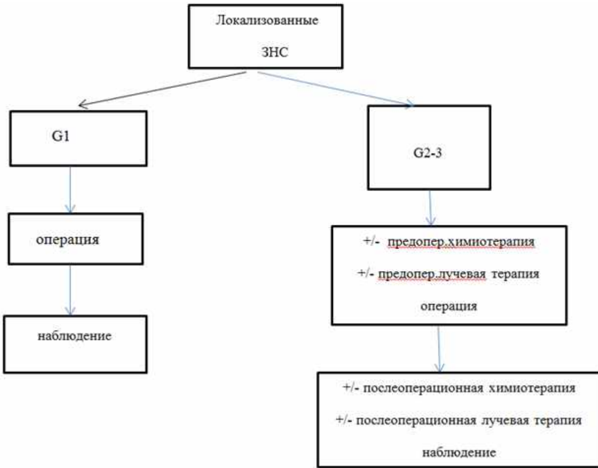
Рис. 1. Схема лечения пациентов с локализованными забрюшинными неорганными саркомами