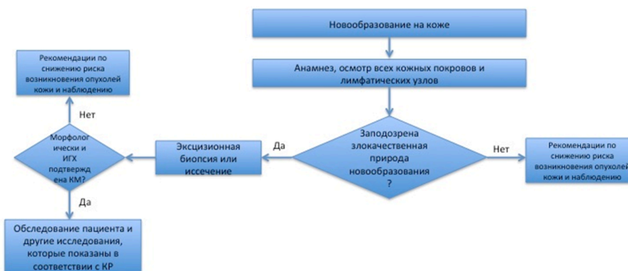
Блок-схема 1. Диагностика и лечение пациента с подозрением на опухоль кожи (КМ)